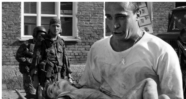
Рис. 1.2. Террористическая акция в г. Беслане, школе № 1 1–3 сентября 2004 г.

Наряду с другими темами виктимология занимается и изучением проблем жертв террористических актов, которыми все чаще становятся не только взрослые, но даже дети, как это было, например, 1–3 сентября 2004 г. в г. Беслане Республики Северная Осетия-Алания (рис. 1.2).