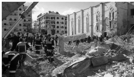
Рис. 1.3. Террористический акт в г. Алеппо (Сирия) 10 февраля 2012 г.

Террористический акт является средством, его использование ведет жертвы к состоянию ужаса. В совокупности же вся цепочка «террорист — террористический акт — террор» составляет терроризм как особое, целостное антиобщественное явление, социальный феномен.