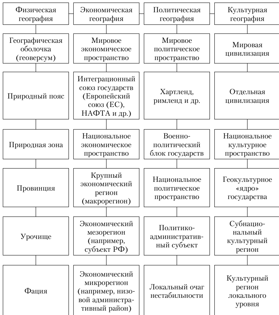
Рис. 3. Вариант иерархии регионов в различных отраслях географии (в нисходящей последовательности)