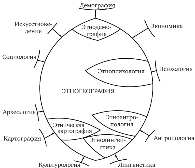
Рис. 1.2. Взаимосвязь этногеографии с другими науками

вновь вернуло этнологию в сферу естественных наук. Автор ее считал, что отнесение этнологии исключительно к сфере исторической науки беспочвенно и деструктивно. Снова повторим его определение. «Этнология, — считал Гумилев, — это естественная наука из разряда географических , построенная как попытка обобщить богатейший исторический материал, накопленный тысячелетиями».